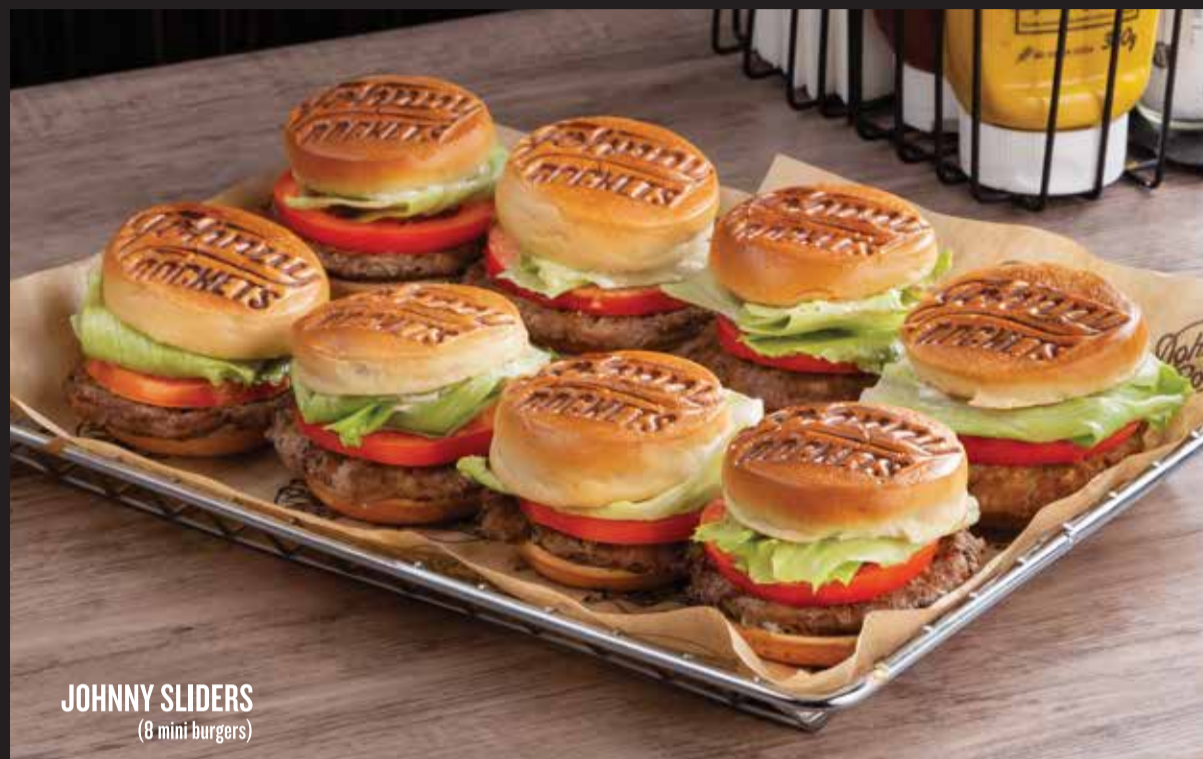
JOHNNY SLIDERS (8 mini burgers)