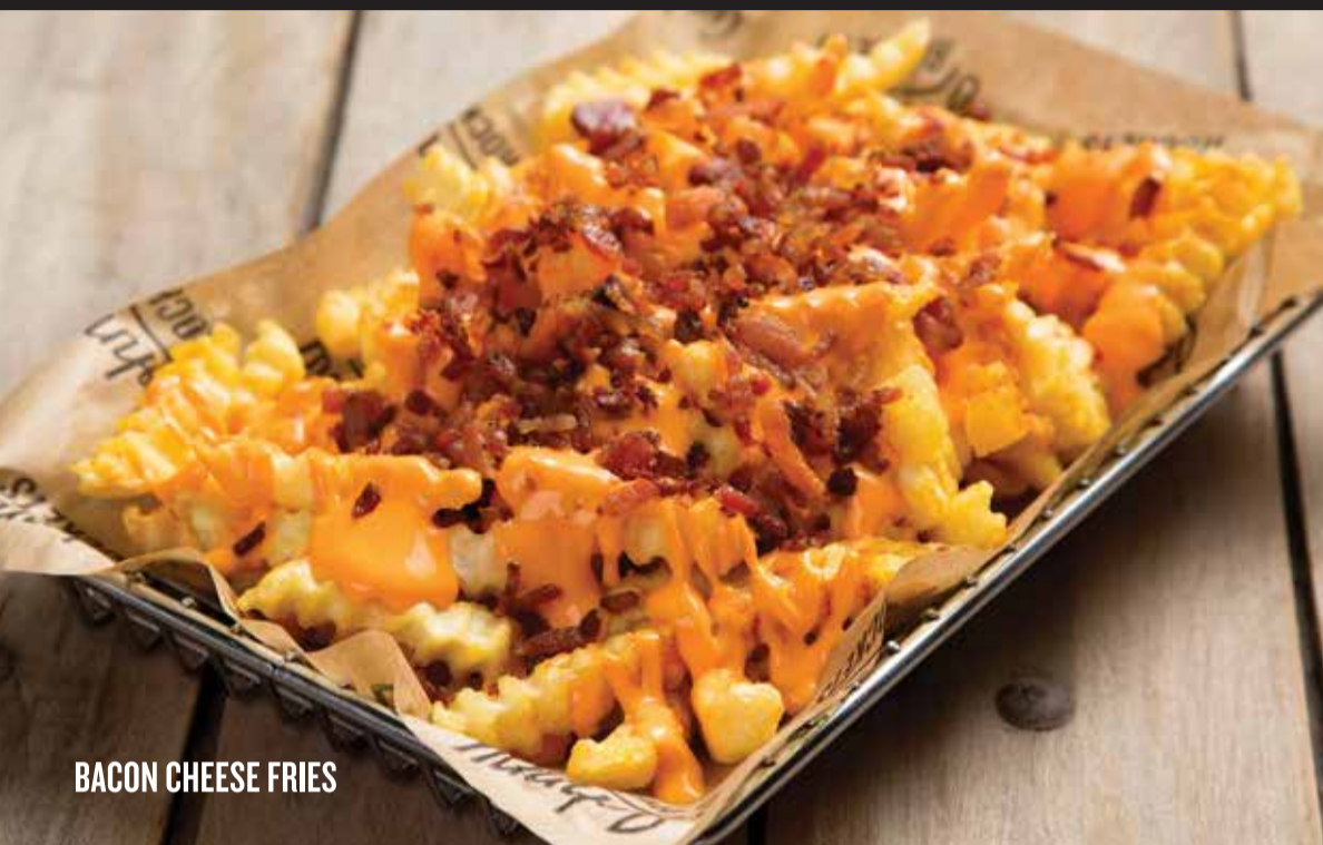
BACON CHEESE FRIES

All Starters have 15% OFF during our Happy Hour (monday to friday, from 4PM till 8PM, except holidays)