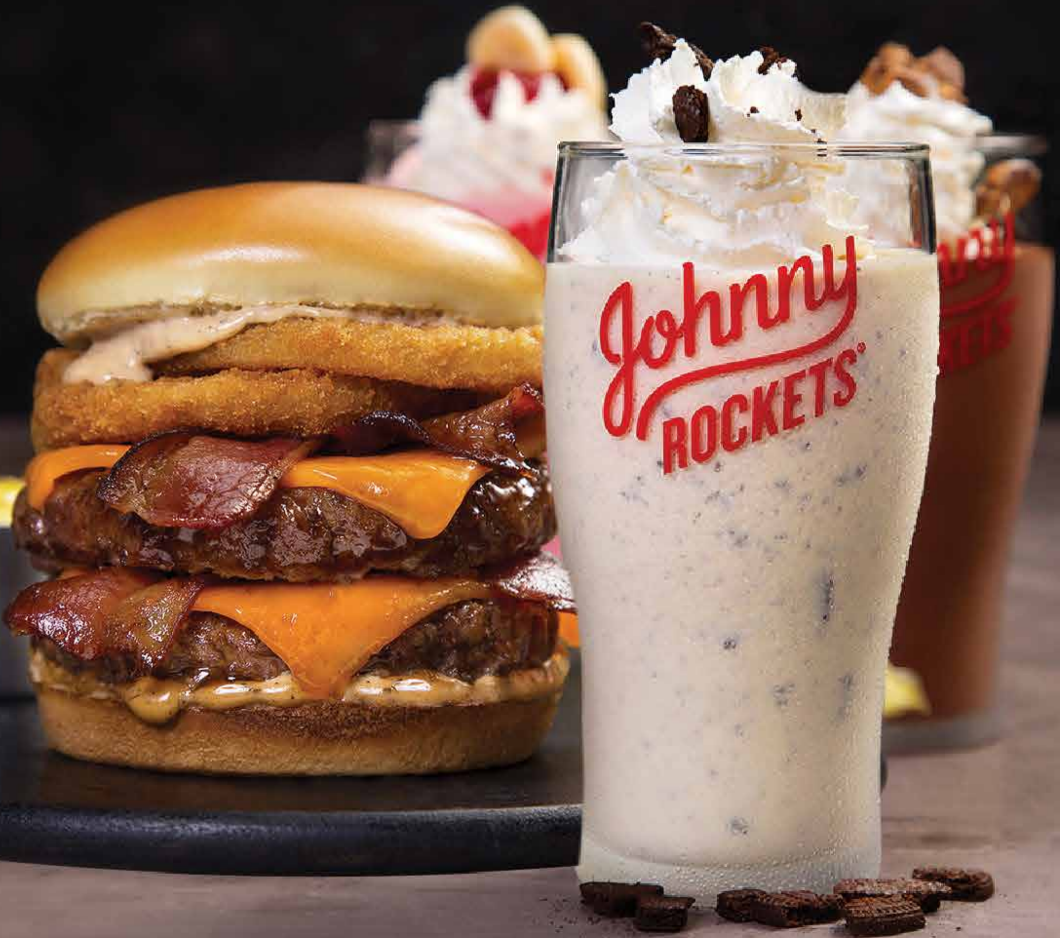
IMAGEM MERAMENTE ILUSTRATIVA / MERELY ILLUSTRATIVA IMAGES